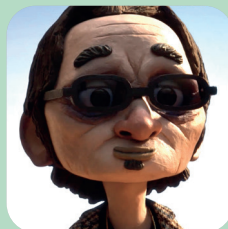
Le chef d'entreprise