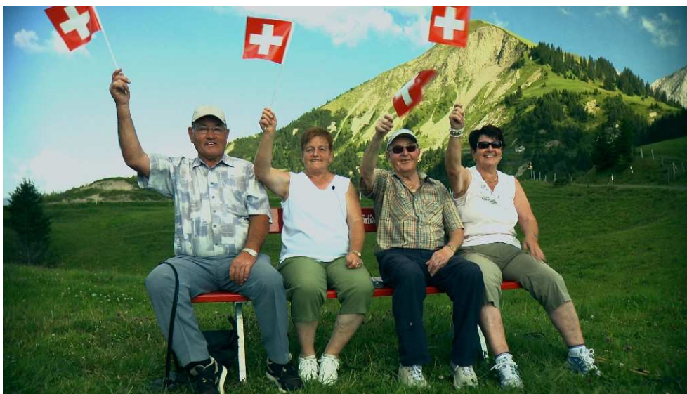
Image Problem ist ein satirischer Dokumentarfilm, der amüsant und mit eigenwilligen Mitteln den Mangel an Solidarität und die zunehmende Fremdenfeindlichkeit im Kleinstaat Schweiz entlarvt.